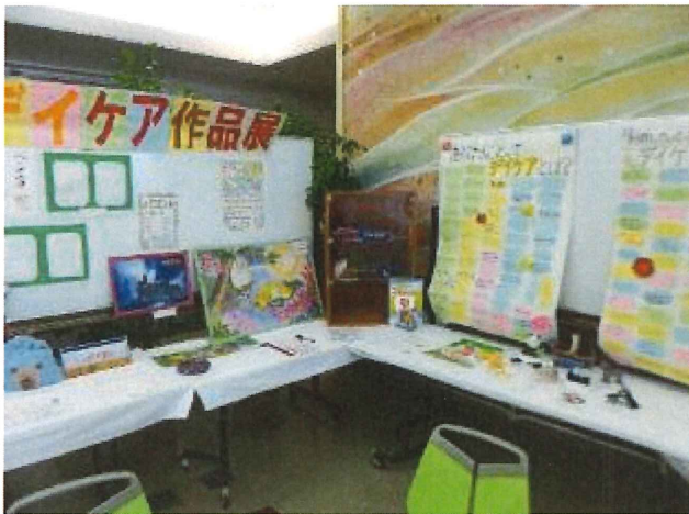
1Fロビーの一部に作品やデイケアの紹介を展示

ミーティングで振り返りをした際には、『お客さんが来てくれてうれしかった』『準備から楽しかった』『ショップの商品を家族も喜んでくれて良かった』といった意見があり、非常に意義のある活動になったと思います。