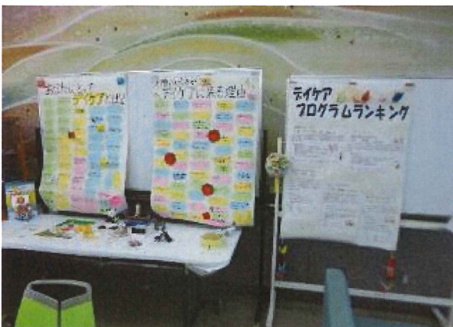
デイケア利用者へのアンケートやコメントをもとに一緒にデイケア紹介を作りました