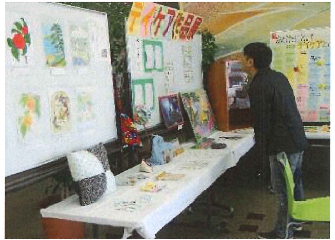
多くの方に展示を見て頂き、ノートにもたくさんのコメントを頂きました